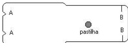
Unir A com B

Retirar a pastilha da embalagem aluminizada (sem perfurá-la). Retirar o protetor do piso adesivo da armadilha e colocar a pastilha no local indicado. Montar a mesma inserindo a ponta do papelão nas partes perfuradas, ficando a parte de cima da armadilha curvada, conforme desenho abaixo.